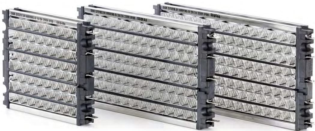
HRKK-D 16/24 (S)